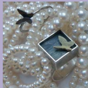
Annette Boonzaaijer Skulp www.skulp.nl